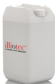
Bidon 20 L