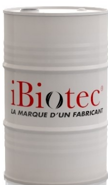
Fût 200 L